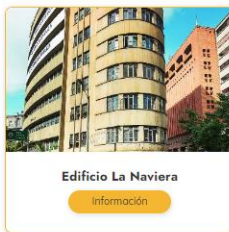
Edificio La Naviera