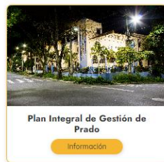
Plan Integral de Gestión de Prado