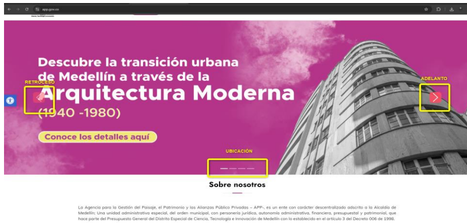
Ilustración 3: Movimientos y parpadeos temporizados

La sede electrónica de la Agencia para la Gestión del Paisaje, el Patrimonio y las Alianzas Público Privadas -Agencia APP- cumple este criterio, ya que se pueden adelantar o retroceder los contenidos, además se puede ver la ubicación de la noticia en la cual se está situado.