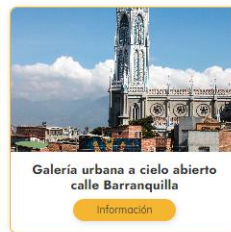
Galería urbana a cielo abierto calle Barranquilla